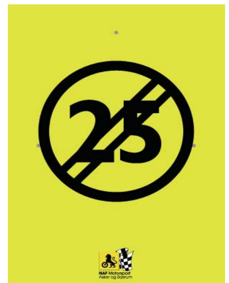
Oppheving av fartsgrense