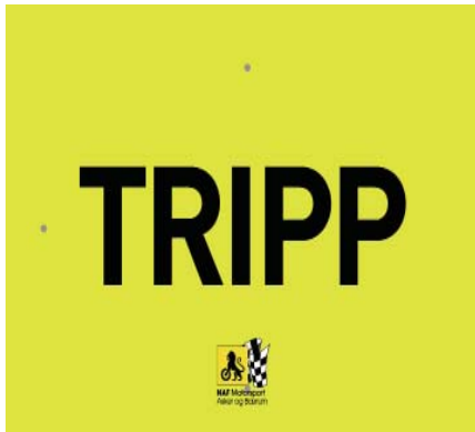
Kontrollavstand for trippteller