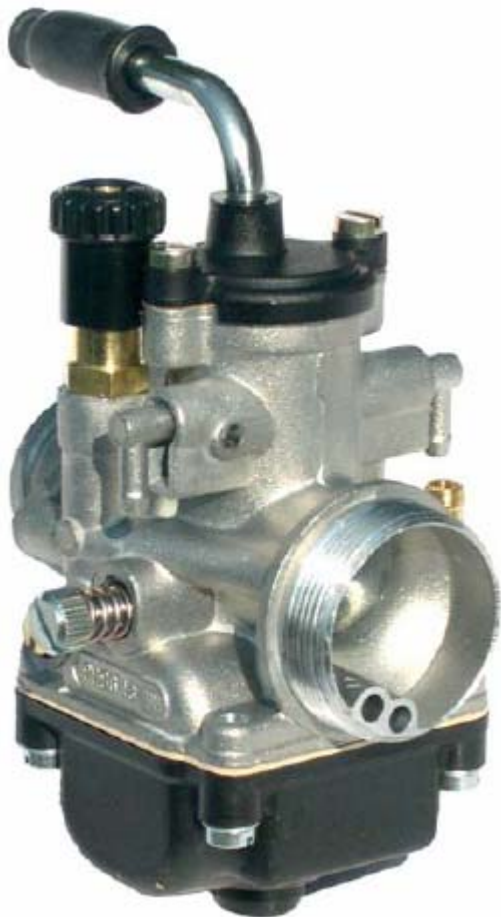
BILDE AV FORGASSER – FORFRA