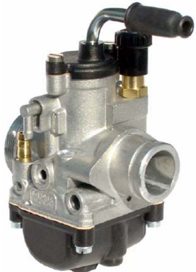
BILDE AV FORGASSER - BAKFRA