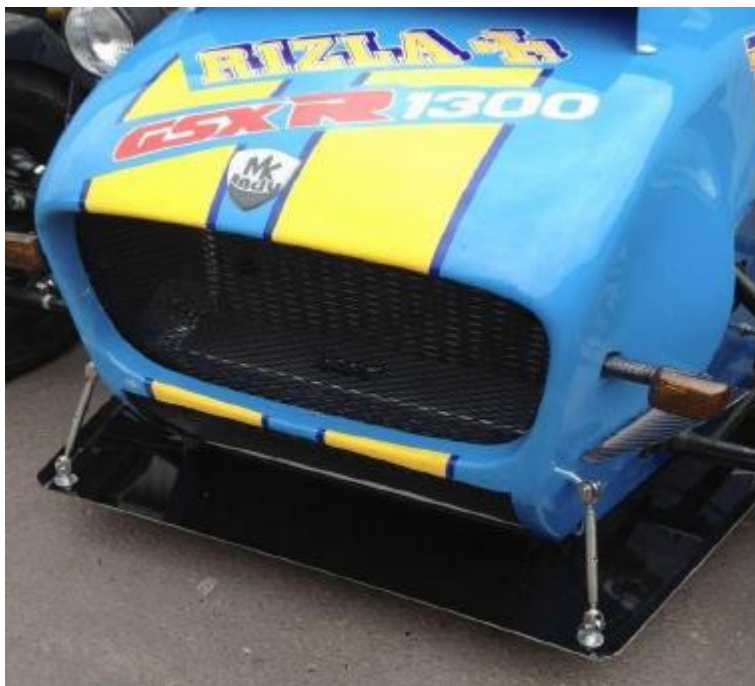
Viser frontsplitter for biler med klassisk karrosseri iht pkt. 12 i Teknisk reglement for Seven Racing.