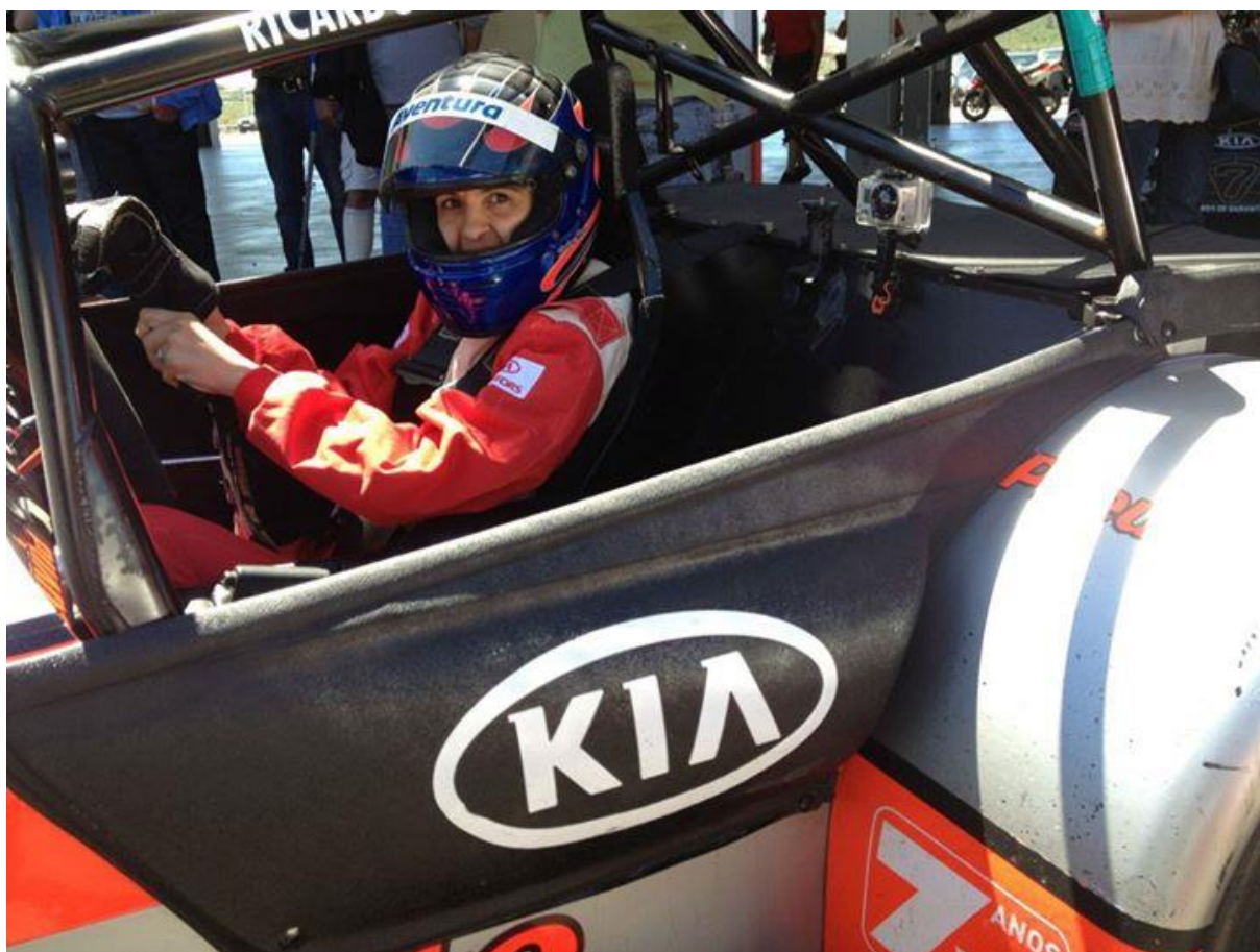
Figur 1 viser halvdør slik denne skal se ut iht pkt. 4.2 i Teknisk reglement for Seven Racing