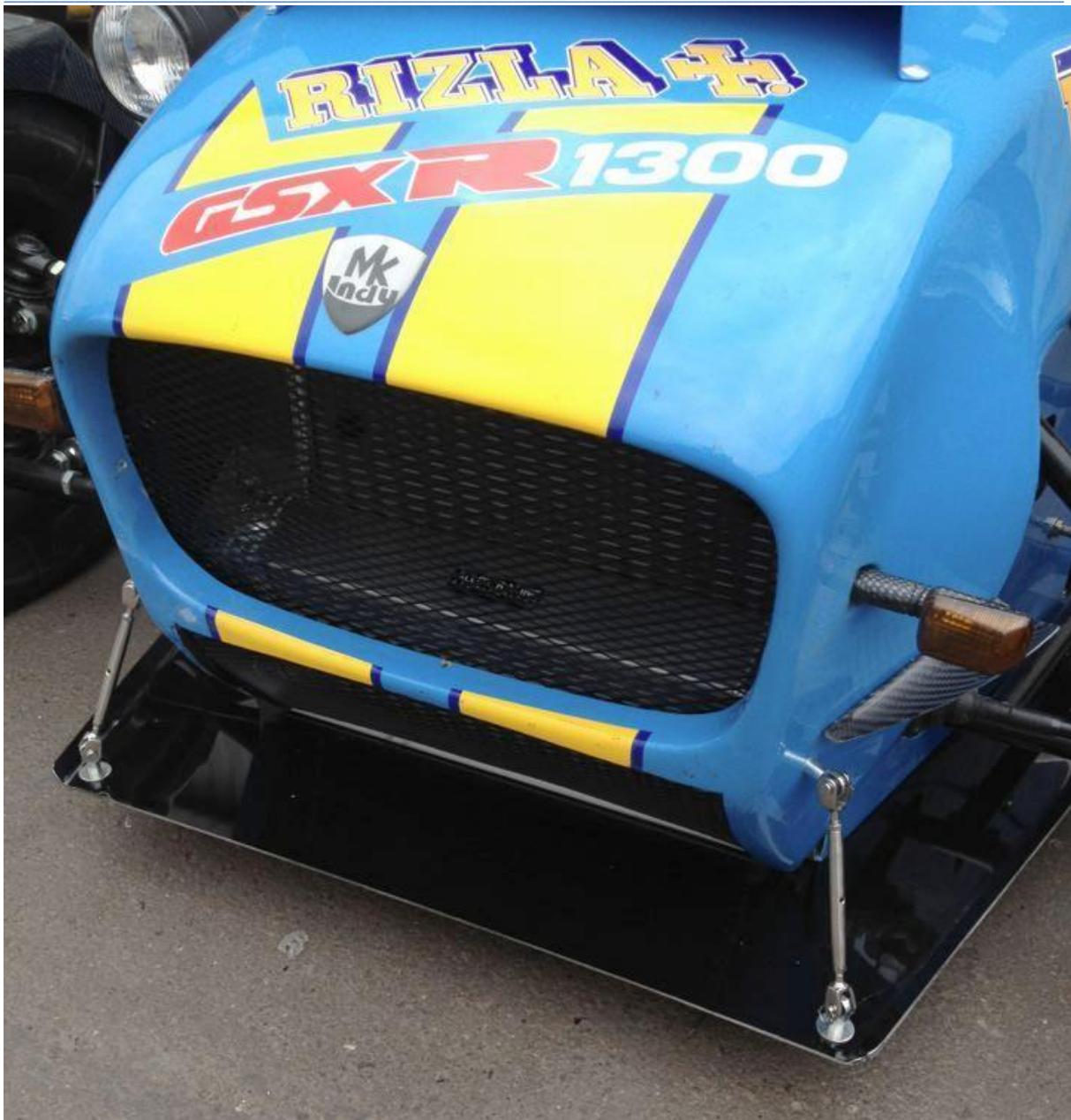
Figur 3 viser frontsplitter for biler med klassisk karrosseri iht pkt. 12 i Teknisk reglement for Seven Racing.